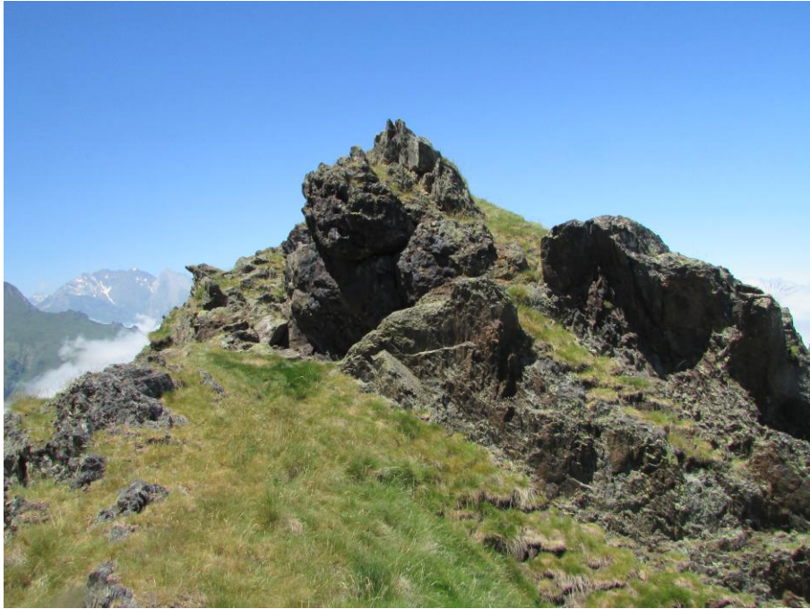
En haut du site d'Estaing