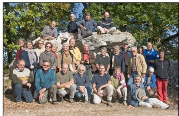
Le groupe devant le dolmen de Naujac (24)