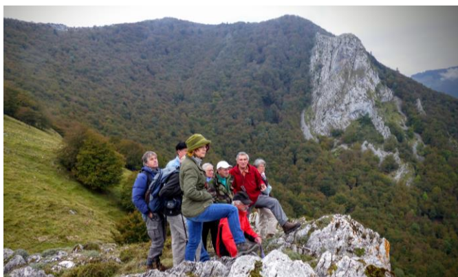
Falaises urgoniennes, Mail d'Arreau

La réunion débuta au sommet du Pic du Jer qui domine Lourdes et ses environs. Les commentaires par Yves Hervouët et Francis Mediavilla devant 25 participants, nous offrirent d'abord de discerner dans le paysage la spectaculaire divagation au cours du Quaternaire de l'exutoire glaciaire au nord de Lourdes puis nous confrontèrent rapidement avec la complexité de la géologie lourdaise au passage du Gave de Pau. Vers l'ouest s'étale un beau synclinal dissymétrique structurant les chaînons calcaires nord-pyrénéens alors que vers l'est s'étend un océan de flysch ardoisier, essentiellement Albien, faisant rapidement soupçonner quelques complexités. En effet, à l'articulation entre ces deux domaines, le Pic de Jer, notre belvédère, est fait d'un empilement de plis-failles, déversés vers le nord sur des écaillés d'ophite triasique et de Paléozoïque témoignant d'un faisceau complexe de failles au passage du Gave de Pau et hérité à la fois d'une structuration ancienne jurassique et de la mise en place du fossé flysch albo-aptien.