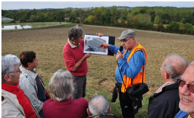
Site d'une ancienne villa gallo-romaine, Lecture

calcaires d'à peine une vingtaine de mètres d'épaisseur, n'en n'est pas moins la deuxième du Gers avec plus de 1000 m de galeries explorées. Ce réseau est l'objet d'un projet de sentiers karstiques. La journée se termina par plusieurs affleurements de calcaires lacustres représentatifs des faciès de la région et par une description du captage de Courrensan.