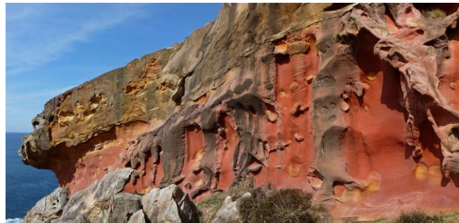
Pano falaise – Jaizkibel

Le jury composé de trois membres du photo-club de Pessac, organisateur d'un concours international annuel, a sélectionné la photo de Magdeleine Delétré. Vous pouvez retrouver d'autres photos ayant participé sur le site Agso.