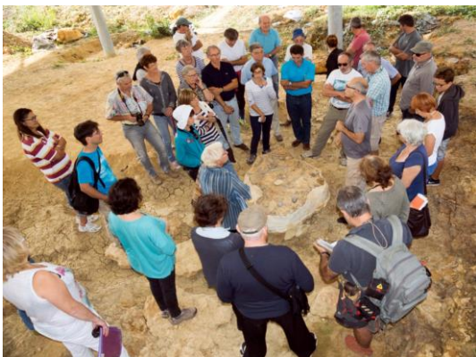
Tous attentifs à l'écoute de la scène qui s'est déroulée il y a 17 millions d'années

Le fond de la rivière est jonché de cet enchevêtrement d'ossements. Puis les eaux s'apaisent, de fins limons se déposent formant un marécage, redoutable piège pour de jeunes rhinocéros bravaches et des vieux trop présomptueux de leurs forces. Soudain un herbivore apparaît sur le bord, ne se doutant pas de la présence de ce gros félin agile qui le guette. Le félin bondit, l'herbivore tente de s'échapper. Mais il est trop tard. L'herbivore vacille et tombe dans ce sédiment meuble. Le félin ne peut stopper sa course. Tous deux périront "côte à côte" ... expression on ne peut plus vraie ici.