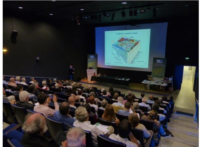
Le public nombreux dans l'auditorium du Muséum

minérales, nappes libres ou captives, pollutions chimiques ou bactériologiques, tout y passe et à travers ce panorama, c'est un débat sociétal sur l'eau qui s'amorce. Les périmètres de protection, la rigueur et la fréquence des analyses, la recherche de nouvelles molécules et le partage de l'eau constitueront l'ossature de cette thématique. La table ronde qui la clôture permet de répondre à de nombreuses craintes du public.