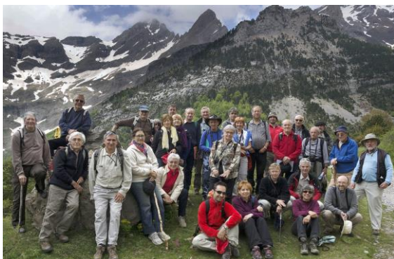
Cirque de Pineta, avec les Astazous et le pic de Tuquerouye au fond

spectaculaires au front de la nappe, maintenant enveloppée d'une couverture crétacée et tertiaire en plis couchés jusque dans les reliefs encore enneigés du Mont Perdu et du Cylindre.