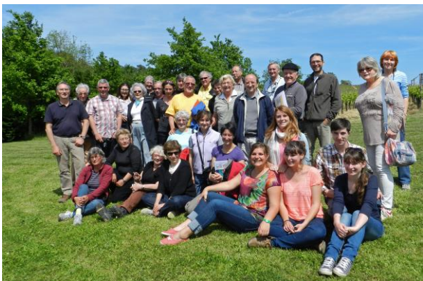
Au cœur du Pécharmant

Au début de l'excursion, les calcaires gréseux jaunâtres de la Formation de Couze (Campanien) ont été présentés près de l'ancienne papeterie de Couze. L'excursion s'est terminée le dimanche dans ces mêmes calcaires à "La Roque" près de Campsegret.