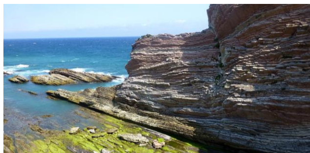
Les flyschs néocrétacés et paléocènes de Zumaia. La limite K/T se trouve dans la mince intercalation argileuse sombre, à la base de la falaise.

La première journée fut consacrée à l'observation des flyschs qui se dressent sur le littoral basque dans les célèbres coupes de Zumaia et d'Izturun. La marée basse permit de suivre dans le détail l'enchaînement des séquences dans les séries redressées du Crétacé terminal et de l'Éocène. On put ainsi cheminer le long de la fameuse couche à iridium de la limite K/T, puis décrypter les enchaînements séquentiels dans les célèbres stratotypes du Paléocène en repérant les deux "Clous d'Or" attribués par la Commission de Stratigraphie de l' International Union of Geological Sciences à la limite Danien-Sélandien (61,1 Ma ; baisse brusque du niveau marin) et à la transition Sélandien-Thanéien (56,7 Ma : inversion du champ magnétique terrestre). Non loin, la coupe de la chapelle de San Telmo offrit un spectaculaire enregistrement des cycles de Milanković (20 000 à 100 000 ans) dans le flysch danien. Après le repas tiré des sacs, nous primes la route de Bilbao pour visiter différents types de venues volcaniques intercalées dans les flyschs crétacés : sill basique d'Eigobar, coulées à pillow lavas et dykes d'Eibar... La journée s'acheva par la montée au sommet du Karakate afin d'admirer au soleil couchant un vaste chaos de blocs trachytiques.